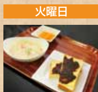
小倉トーストと クラムチャウター