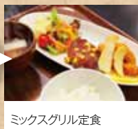
ミックスグリル定食