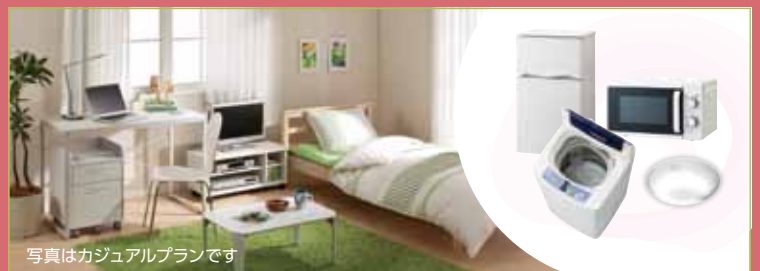
写真はカジュアルプランです

デザインルームなら、家具・家電付きでさらに、新品の生活用品約50点が付いたお部屋をご用意しています。入居してすぐに快適生活を始めることができます。