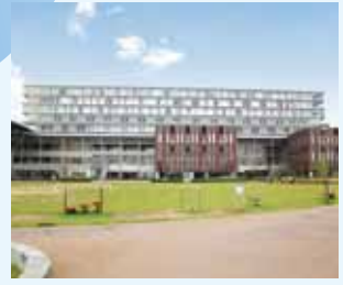
大阪いばらきキャンパス