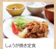
しょうが焼き定食